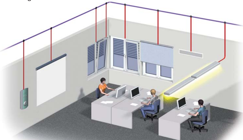
Roto E-Tec Drive: Integriert in Ihr Gebäudemanagement-System

Roto E-Tec Drive lässt sich sehr einfach an Gebäudemanagement-Systeme anbinden: über BUS, konventionelle Schalteingänge sowie per Funk. Fenster können schalter-, zeit- bzw. sensorgesteuert geöffnet und geschlossen werden – dezentral wie auch zentral. In Verbindung mit Fensterkontaktelementen wird die Interaktion mit z.B. Jalousien, Heizung oder Klimaanlage sichergestellt.