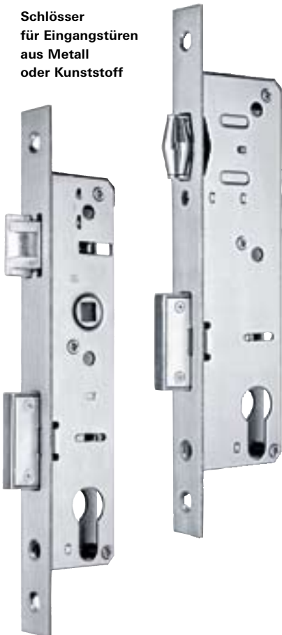
Schlösser für Eingangstüren aus Metall oder Kunststoff