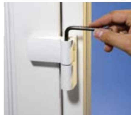
Verstellung des Anpressdrucks