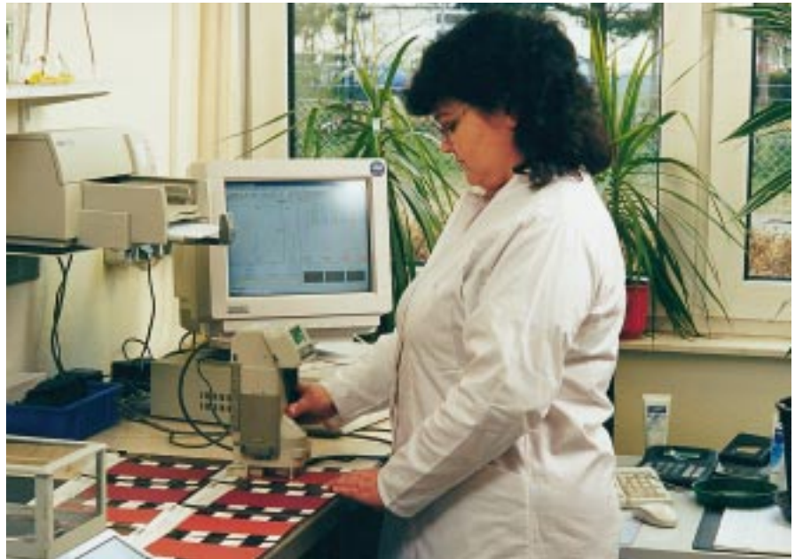
Farbanalyse im Dachsteinwerk Heusenstamm

Im Zusammenhang mit der neutralen Beschreibung von Farben an Hand von Farbvergleichsmustern wird immer wieder die so genannte RAL-Nummer nachgefragt.