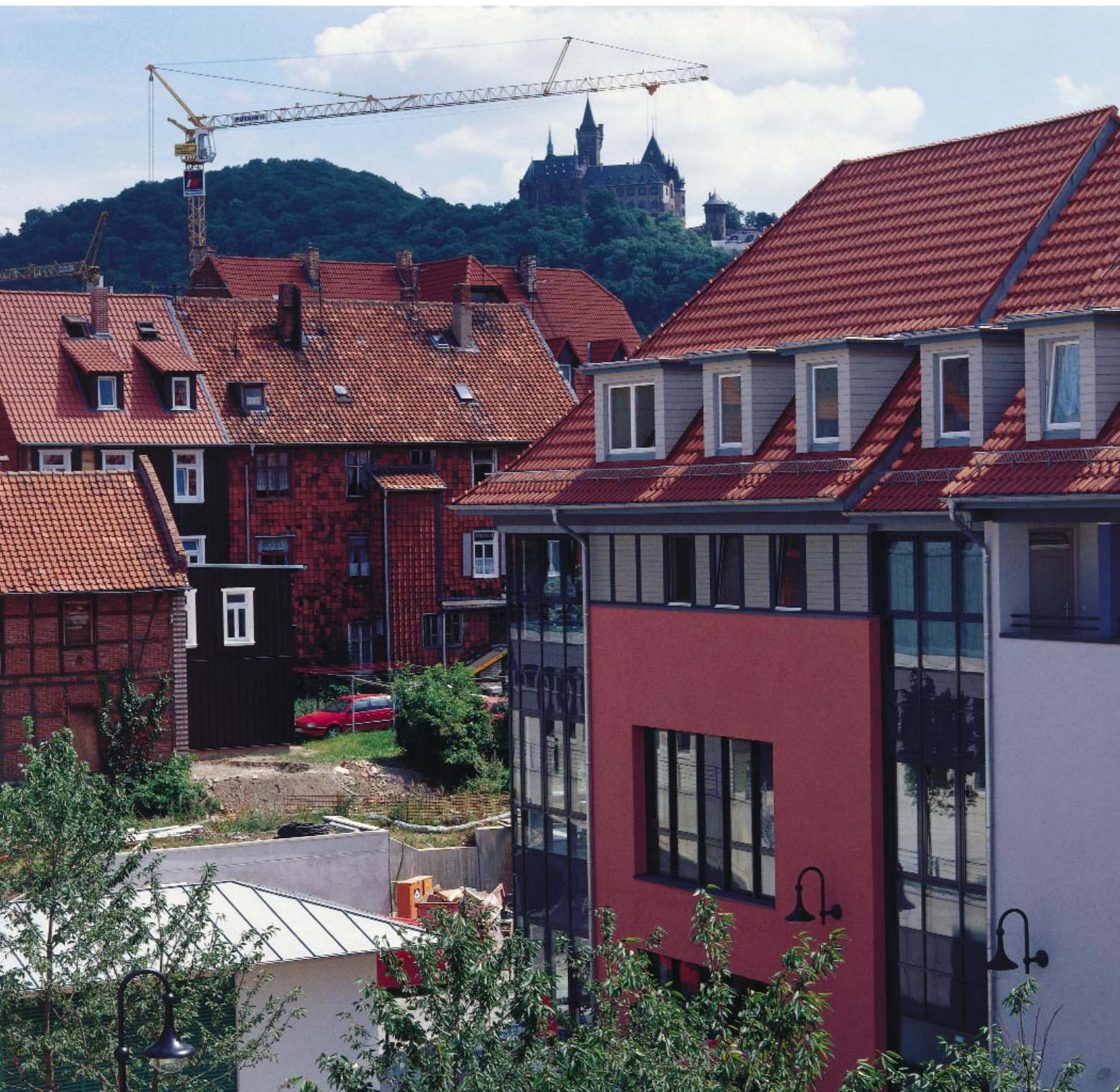
Harmonische Dachgestaltung mit Dachziegeln

man ebenfalls geneigt diese Beliebigkeit zu bedauern. Finden sich doch auf kleinstem Raum Dächer mit unterschiedlicher Bauform, Dachneigung, Firstausrichtung und Dachdeckungsmaterial in unterschiedlichen Farben direkt nebeneinander.